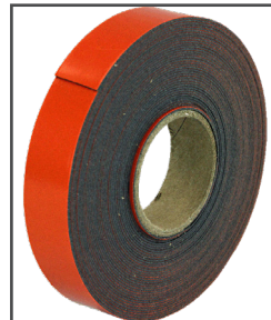
Make-A-Bond MC Ruban adhésif double face