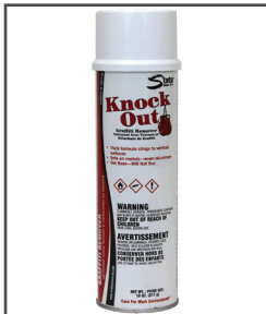
Knock Out MC Décapant aérosol pour graffitis et salissures