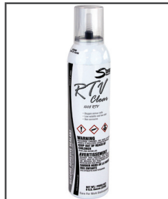
RTV MC Adhésif silicone/scellant/ calfeutrant/joint d'étanchéité